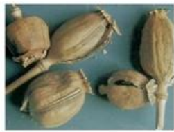
鸦片（包括罂粟壳、花、苞、叶）