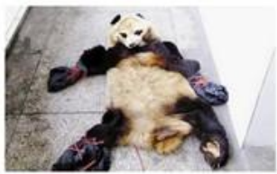
受保护动物皮革、皮毛